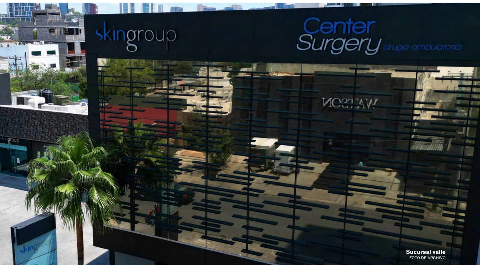
Sucursal valle