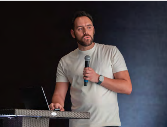
Por: Pedro Terlizzi